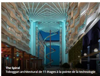
The Spiral Toboggan architectural de 11 étages à la pointe de la technologie